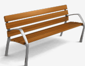
NeoBarcino CLASSIC UM304N