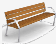
NeoBarcino ALUMINIUM UM304AL