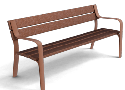
Citizen Eco UM301PR