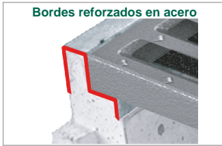
Bordes reforzados en acero