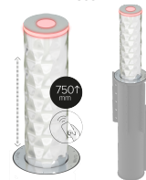
RAMBLA Ø220 x 750mm H7508R